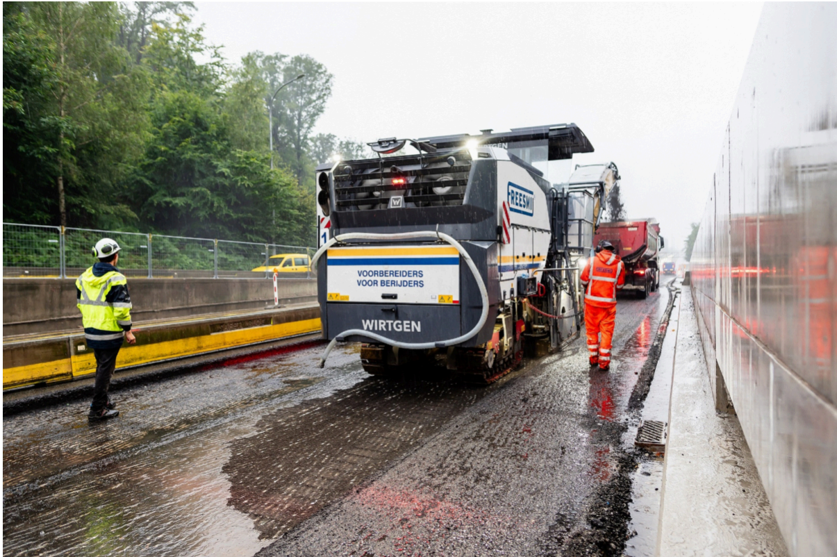
Freeswerken 10 en 11 juli (15 cm asfalt werd afgefreesd)