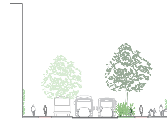
... met een laad- en loszone.