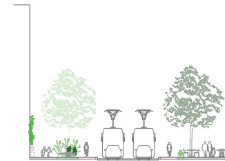
... met veel verblijfsruimte.