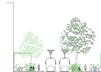
... met heel veel groen.