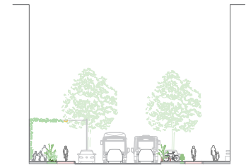
... met parkeerplaatsen.