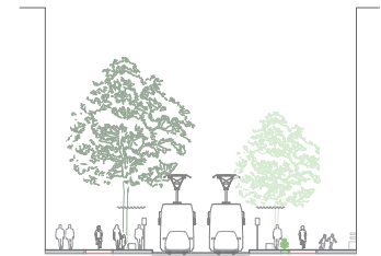
... met een bushalte.