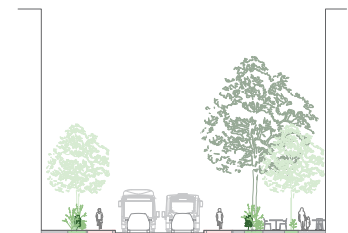
... met veel vrije ruimte aan één kant.