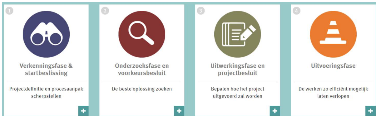
Figuur 1: Schema van de verschillende projectfases binnen de procedure complexe projecten.

De procesaanpak is gebaseerd op de procedure die in het decreet complexe projecten van 25 april 2014 werd uitgetekend. Deze omvat vier fases (verkenningfase, onderzoeksfase, uitwerkingsfase en uitvoeringsfase). Er zijn drie beslismomenten (startbeslissing, voorkeursbesluit en projectbesluit). Daarbij worden twee openbare onderzoeken voorzien (ter voorbereiding van het voorkeurs- en projectbesluit). Het ontwerp en de onderzoeken verlopen op een geïntegreerde manier, wat betekent dat alle relevante thema's gelijktijdig onderzocht zullen worden om kansen ten volle te benutten en de algemene kwaliteit van het project te verhogen. Deze aanpak betreft een werkwijze die steunt op participatie, openheid en overleg. Ze beoogt een efficiënt en kwaliteitsvol proces , dat gericht is op de realisatie van een complex project binnen een aanvaardbare termijn en met een maximaal draagvlak .