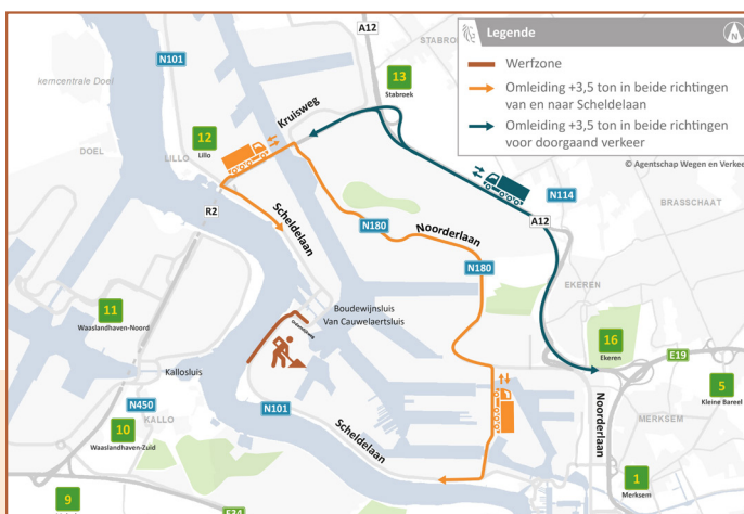
Omleiding zwaar verkeer (+3,5t) vanaf 31 augustus