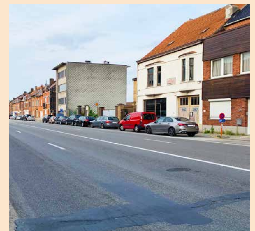
/ De verouderde Bergensesteenweg heeft dringend nood aan een heropwaardering.

Bij de start van de volgende fases zal er meteen op verschillende fronten tegelijkertijd gewerkt worden, door verschillende aannemers en onderaannemers. Dit maakt dat er onmiddellijk veel arbeiders en werktuigen te zien zullen zijn. De verschillende werfzones zullen elkaar kort opvolgen. De planning is vooral afhankelijk van de vordering van de rioleringswerken. Deze werken zijn niet steeds heel zichtbaar voor voorbijgangers, maar wel heel arbeidsintensief en onvoorspelbaar. Slechte grondlagen of conflicten met nutsleidingen kunnen de planning zomaar in de war sturen. De aanleg van de wegverharding erboven gaat een stuk vlotter.