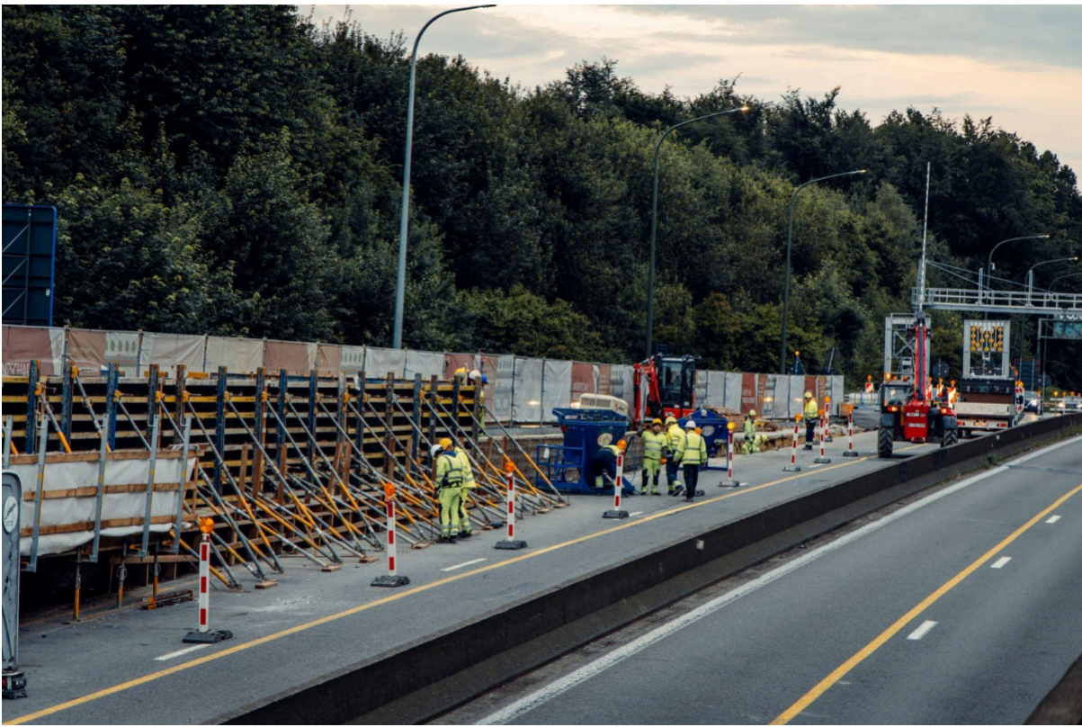
Juni 2024, renovatie van de zijwand