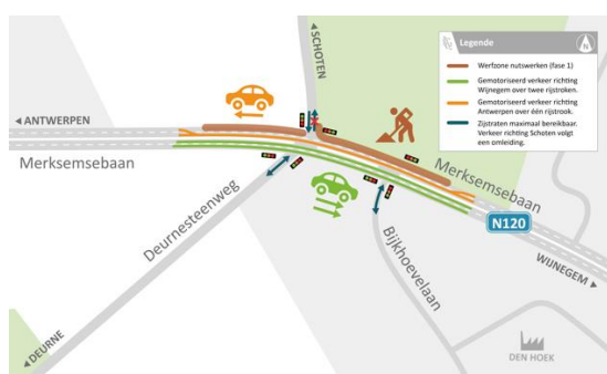
Verkeerssituatie van maandag 10 tot en met donderdag 13 februari 2020.

De werken voor de doorsteek duren vanaf maandagochtend 10 t.e.m. donderdagavond 13 februari.