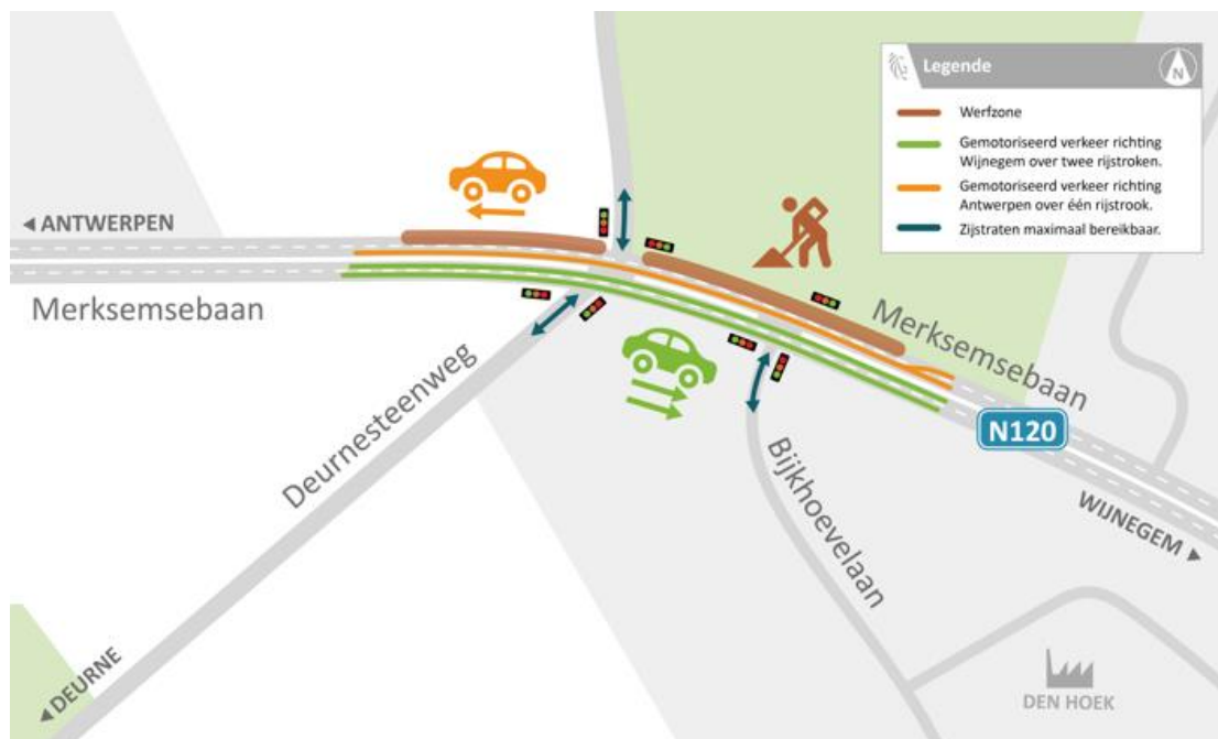
Verkeerssituatie vanaf 27/01/20

Vanaf maandag 27 januari werkt de aannemer aan de noordzijde van de Merksemsebaan (fase 1) , ruwweg tussen de Bijkhoevelaan en de Deurnesteenweg. Tijdens de werken is de rechterraijstrook niet beschikbaar. Autoverkeer richting Antwerpen verloopt er gedurende een 4-tal weken over één rijstrook in plaats van twee. Voetgangers en fietsers kunnen de werken passeren via een afgeschermdoorgang.