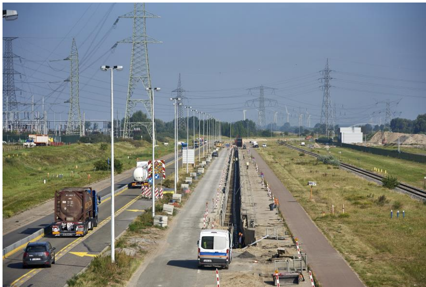
Foto: kabels in open sleuf boven het sluisencomplex

Elia heeft haar sleuf- en kabelwerken boven het sluisencomplex volledig afgerond. Via een gestuurde boring werden de hoogspanningskabels onder het sluisencomplex getrokken. Een van onze aannemers bracht die werken in beeld. Hier kan je het filmpje bekijken: https://www.youtube.com/watch?v=HdpfmWvAMJY&t=5s