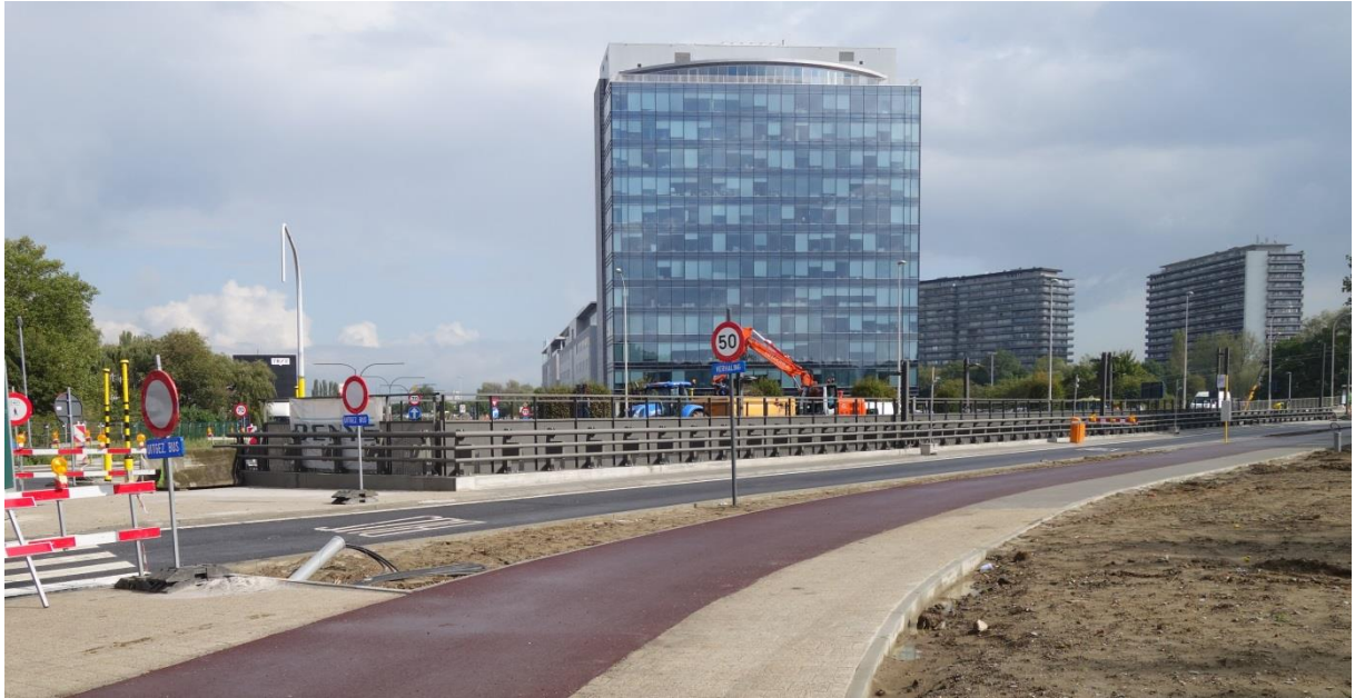
De open tramhelling aan de Turnhoutsebaan.